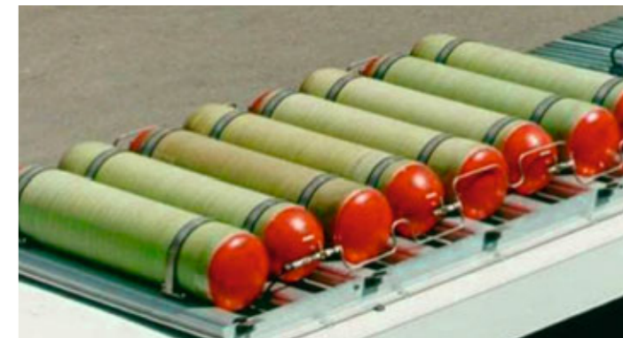
CNG-Speichersystem mit bis zu 1712 Liter Volumen.