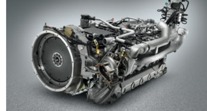
6-Zylinder-Erdgasmotor in liegender Version.