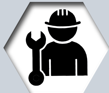
MAN | Service